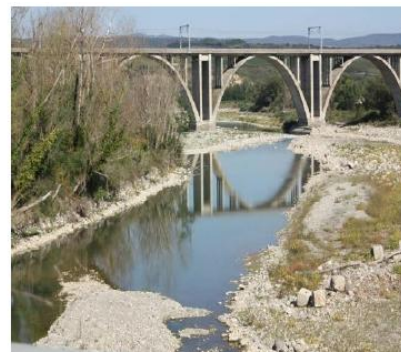
Luglio 2012, Siccità F. Paglia ( Ponte direttissima)