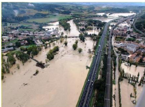
12 novembre 2012, Alluvione F. Paglia Orvieto Scalo